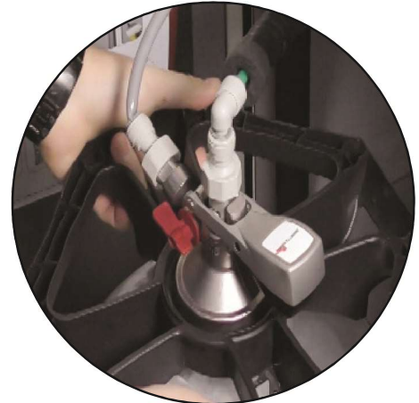
Listo para usar