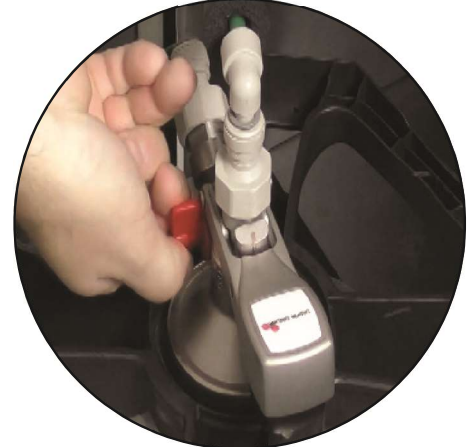
Gire la palanca para desgasificar